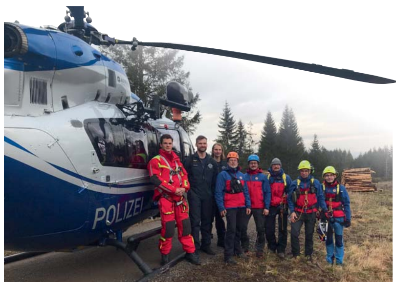
Die Crew des Polizeihubschraubers und Mitglieder der Bergwacht Harz vor dem Helikopter.