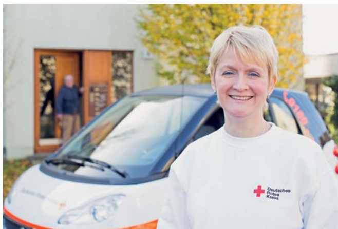
Ungefähr 400 Beschäftigte profitieren vom Modelltarifvertrag.