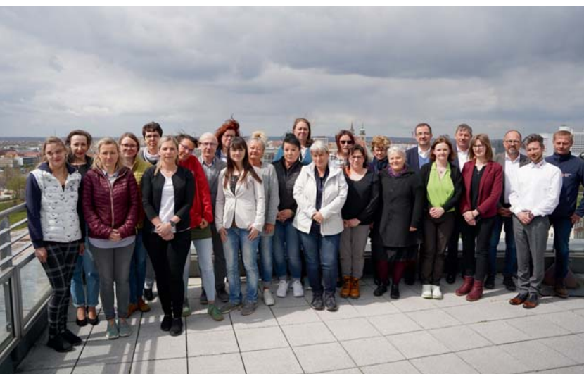
Die Teilnehmenden der DRK AG Bundesteilhabegesetz.

Am 26. April 2023 hat sich die DRK AG Bundesteilhabegesetz in Magdeburg getroffen. Ziel der Arbeitsgruppe ist, die Dienste und Einrichtungen des DRK Landesverbandes Sachsen-Anhalt e.V. auf Grundlage der aktuellen Verhandlungsergebnisse optimal auf das Umstellungsverfahren für 2024 vorzubereiten. Die Umsetzung des Landesrahmenvertrages in Sachsen-Anhalt zum Thema Stärkung der Teilhabe und Selbstbestimmung von Menschen mit Behinderungen befindet sich in einer heißen Phase. Die Teilnehmenden der AG wurden mit einem aktuellen „Handwerkskoffer“ unter rechtlicher Begleitung der Rechtsanwaltskanzlei Dr. Wirtz ausgestattet, der wertvolle Informationen zum Umstellungsverfahren beinhaltet. Neben inhaltlich-konzeptionellen Hinweisen wurde sich beim Treffen ebenso zur strategischen Ausrichtung verständigt. Am 21. September wird die nächste Sitzung der DRK AG Bundesteilhabegesetz stattfinden.