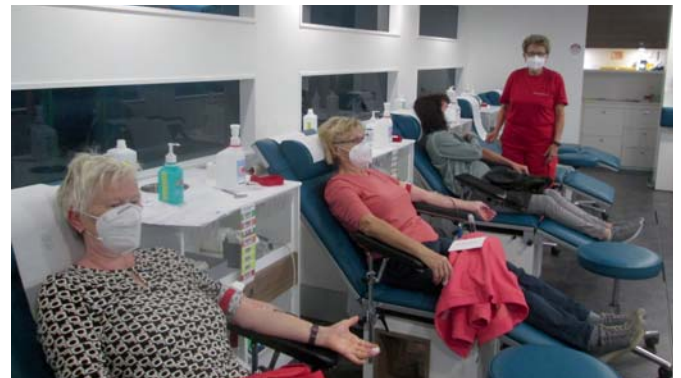
Modern und geräumig: das neue Blutspendemobil des DRK.