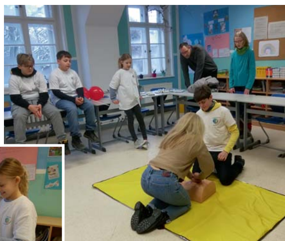
Gezeigt wurde, wie Verbände angelegt werden und wie Herzdruckmassage funktioniert.